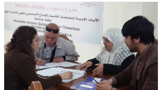
Projet Nasije : Réunions avec les associations pour le "Développement accompagné des idées" - Novembre 2016

• Le projet Nasije "Nouvelles actions solidaires pour l'insertion socio-économique des jeunes exclus" mis en œuvre dans les quatre wilayas pilotes du PAJE depuis janvier 2016 par la Fédération handicap international. Après avoir bénéficié d'une subvention de 1 155 000 €, le projet a soutenu financièrement au 31 janvier, 31 associations locales.