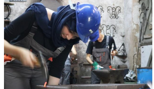
Projet SDH : Formations et chantier école dans les métiers traditionnels du patrimoine

• Le projet d'école chantier pour la formation professionnelle et l'employabilité des jeunes mis en œuvre dans la wilaya d'Oran par l'association Santé sidi el houari (SDH). Avec une subvention de 199 000 €, le projet a réussi après une année d'exercice (au 31 janvier) à sensibiliser ou initier plus d'une centaine de stagiaires et à engager au moins 94 jeunes dans des formations aux métiers traditionnels du bâti.