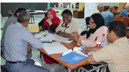
Formation GCP Béchar - Mai 2016

Pour les trois projets, des appels à propositions sont lancés depuis le mois de juillet 2016.