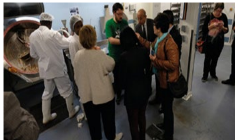
Voyage d'études France 2 : Visite ferme biologique Massy Palaiseau (ESSI)

Pour mieux appréhender la problématique liée à l'insertion des jeunes par l'activité économique dans le cadre de l'économie sociale et solidaire et observer les outils et dispositifs d'accompagnement des jeunes en matière d'emploi et de création d'activités génératrices de revenus, 2 voyages d'études vers la France et 1 vers l'Allemagne ont été organisés au profit de 31 cadres des institutions concernées par les politiques en faveur de la jeunesse et des agences publiques de soutien à l'emploi.