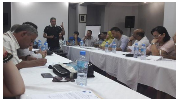
Rencontre avec les associations (focus group) - Annaba - 20 Sept. 2016.

Le PAJE a lancé en décembre 2016 un appel à candidature qui a permis la sélection de 80 stagiaires formateurs (à raison de 20 par wilaya pilote) qui, à l'issue d'une formation, renforceront à leur tour, les compétences des associations au niveau local. Le premier cycle de la formation de formateurs portera sur "le management associatif". ( Développement et mise en place confié au prestataire de services SOFRECO )