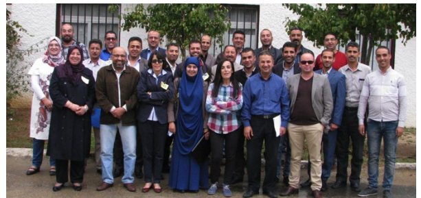
Formation CEFE - Khenchela - Septembre 2016

4 ateliers de sensibilisation à la méthode compétences économiques par la formation à l'esprit entrepreneurial (CEFE), et destinés aux personnels des dispositifs d'appui et de soutien à l'entrepreneuriat, ont été réalisés dans les quatre wilayas pilotes entre juillet et octobre 2016. Cette activité a été mise en œuvre par la GIZ.