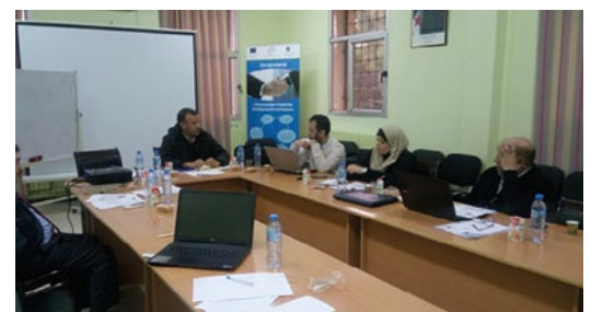
Projet A'amal : Comité de sélection des projets associatifs - Khenchela - Octobre 2016

• Le projet Innov'Asso "Les métier et compétences du secteur associatif au service de l'employabilité des jeunes algériens" qui est mis en œuvre dans les wilayas de Khenchela et d'Oran par le GRDR (Migration - Citoyenneté - Développement) depuis janvier 2016. Après avoir bénéficié d'une subvention de 800 000 €, le projet a soutenu financièrement au 31 janvier, 5 associations locales.