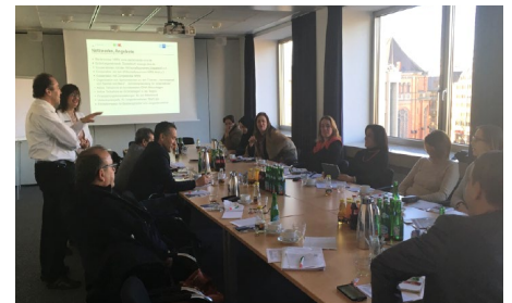
Voyage d'études Allemagne : Visite start-up center Chambre de commerce et d'industrie (IHK) - Düsseldorf